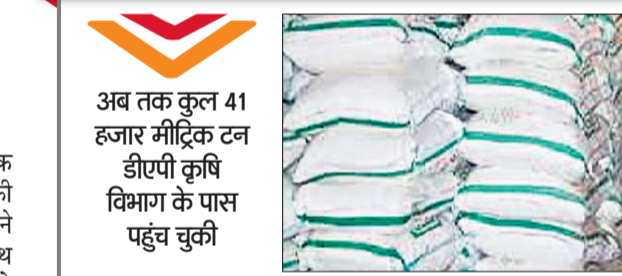
हरिभूमि न्यूज | रोहतक

अब तक कुल 41 हजार मीट्रिक टन डीएपी कृषि विभाग के पास पहुंच चुकी रोहतक। जिले में किसानों को लंबे इंतजार के बाद आखिरकार राहत मिली है। कृषि विभाग को डीएपी का एक और बड़ा रैक प्राप्त हुआ है, जिससे खेतों में बुवाई की रफ्तार तेज होने की उम्मीद है। विभाग के अनुसार हाल ही में 17 हजार मीट्रिक टन डीएपी का रैक रोहतक पहुंचा है। इससे पहले 24 हजार मीट्रिक टन डीएपी की खेप आई थी। इस तरह अब तक कुल 41 हजार मीट्रिक टन डीएपी कृषि विभाग के पास पहुंच चुकी है। पिछले कुछ हफ्तों से जिले के कई इलाकों में डीएपी की कमी से किसान परेशान थे। समितियों पर लंबी छतारें लग रही थीं और कई बार किसानों को खाली हाथ लौटना पड़ रहा था। खाद की कमी के कारण गेहूं की बुवाई में देरी का खतरा मंडरा रहा था। अब नए रैक के आने से किसानों में उत्साह का माहौल है। कृषि विभाग ने बताया कि नई खेप मिलते ही डीएपी का वितरण तेजी से शुरू कर दिया गया है। सभी सहकारी समितियों और बिक्री केंद्रों को पर्याप्त स्टॉक उपलब्ध कराने के निर्देश दिए गए हैं ताकि किसी किसान को परेशानी का सामना न करना पड़े।