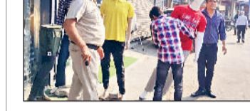
हरिभूमि न्यूज | रोहतक

निगम की टीम ने मुख्य बाजारों और व्यस्त इलाकों में सड़कों व फुटपाथों पर किए गए कब्जों को हटवाया और अवैध रूप से रखे गए सामान को जब्त किया। निगम ने करीब 30 से अधिक दुकानदारों से अतिक्रमण हटवाया।